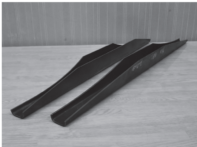
写真 1 U 曲げ外観