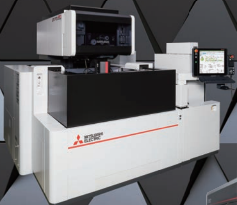
ワイヤ放電加工機 MP D-CUBESシリーズ