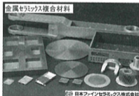
金属セラミックス複合材料