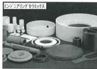
エンジニアリングセラミックス