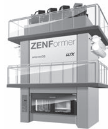
ダブルスライド サーボプレス