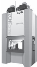
シングルスライド サーボプレス