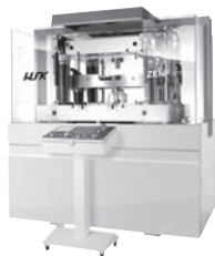
粉末成形用 サーボプレス plus