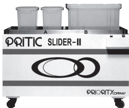
プリティック スライダーII