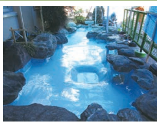
トップコート塗布