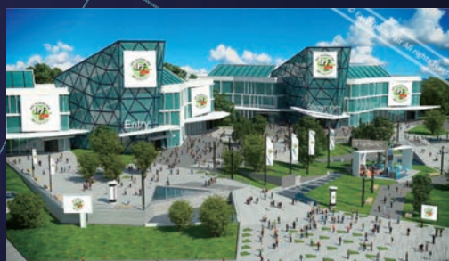
プラットフォーム:EASY Virtual Fair