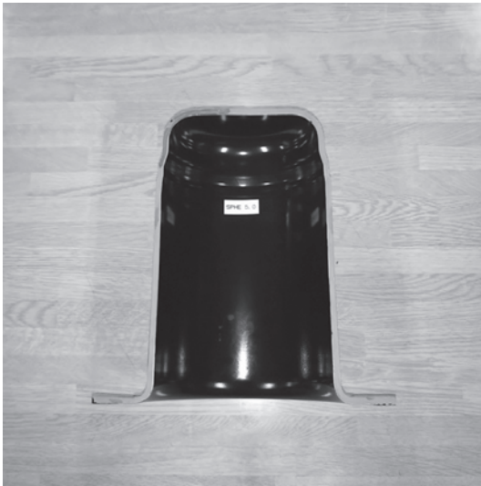
写真 1 完成品を分割したサンプル