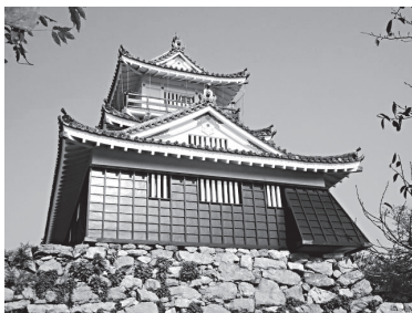
写真1 浜松城天守閣の石垣

備範囲を守りつつ、互いにうまく組み合わせられて、シンプルな構造ながら強固な石垣になっている。野面積みは、地震により後世の建造物は破壊しても、今なおビクともせず、その強さが歴史的にも証明されている。