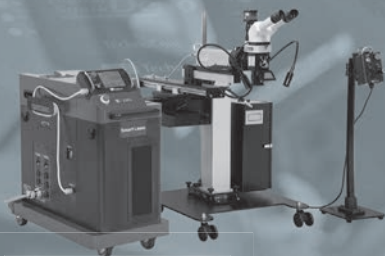
Portable Fiber Laser Welder Smart Laser TL-150/300/450LDA スマートレーザー 高出力「450Wモデル」を新たに追加