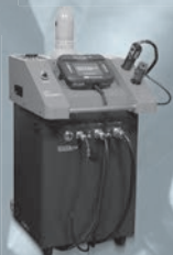
NEW Digital Spark Depo デジタルスパークテポ