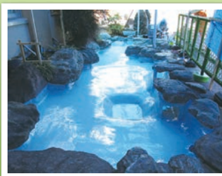
トップコート塗布