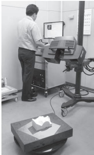
リバースエンジニアリング