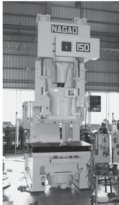
オーバーホール後